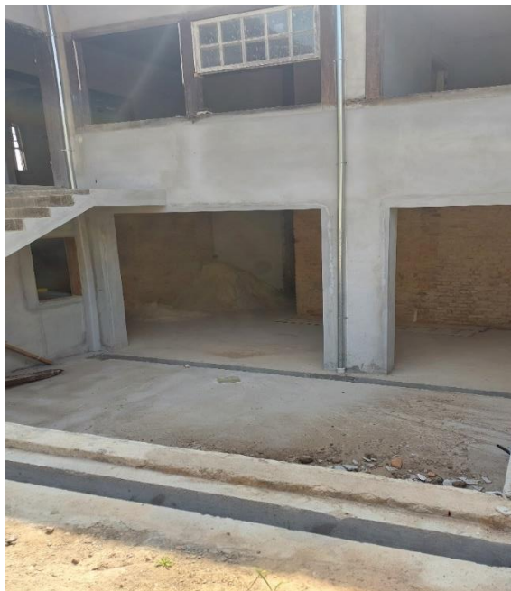
Fachada posterior da edificação e vista do pavimento inferior Data:04/09/2024