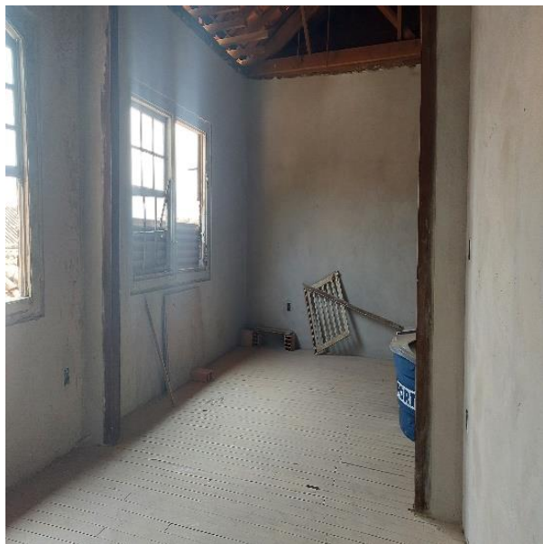
Paredes internas com reboco acabado. Data:04/09/2024