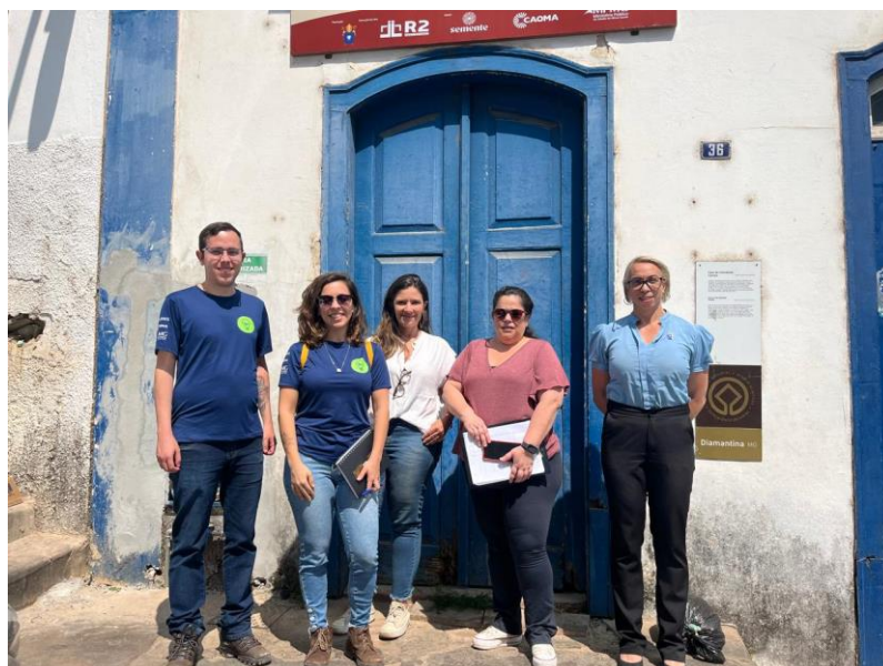
Equipes do Semente, Mitra e prestadoras de serviço Data:04/09/2024